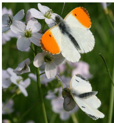
Wiesenschaumkraut mit Aurorafalterpaar

Feingehackte Kräuter, Zitronensaft, Salz und Pfeffer vermengen. Die Eier verquirlen und zu den Kräutern geben. Die Omelettmischung mit wenig Fett in der Pfanne stocken lassen und wenden. Das fertige Omelett auf einem Teller mit saurer Sahne oder Schmand bestreichen und mit Schaumkrautblättchen garnieren.