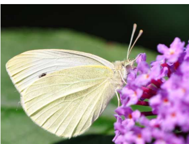
Kleiner Kohl-Weißling- Er liebt lila Blüten.

Seit alters her üben Schmetterlinge eine große Faszination auf den Menschen aus. Viele verschiedene Wildpflanzen wie Disteln, Brennnesseln, Dost, Wilde Möhre und andere Blumen werden von den Faltern aufgesucht. Diese Pflanzen sind wichtige Nahrungslieferanten für die Raupen und begehrte Nektarspender für die ausgewachsenen Schmetterlinge. Leider gibt es viele Gartenbesitzer, die absolut keine „Unkräuter“ (sprich Wildkräuter) in ihrem Garten dulden, gern aber den bunten Faltern nachschauen und sich wundern, dass sie in sterilen Einheitsgärten besonders rar sind. Der Sommerflieder ( Buddleja davidii ), auch bekannt als Schmetterlingsstrauch, ist zwar keine Alternative zum naturnahen Garten, bietet aber die Möglichkeit, Schmetterlinge anzulocken. Die stark duftenden, meist lilafarbenen Blüten erscheinen im August und ziehen Schmetterlinge magisch an. Bei Sonnenschein kann man dutzende Nektar saugende Tagpfauenaugen, Admirale, Distelfalter, Kleine Füchse, Große und Kleine Kohlweißlinge und andere Arten beobachten und manchmal sogar aus geringer Distanz fotografieren. Geeignete Buddleja-Sorten, auch weiß blühende, sind im Fachhandel erhältlich. Die Blütenrispen werden auch von vielen anderen Insektenarten befliegen, was letztlich auch der Vogelwelt im Garten zu Gute kommt.