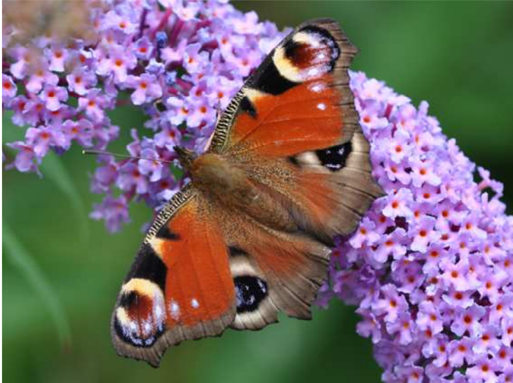
Tagpfauenauge- gern auf Buddleja in Gärten und Parks

Seit alters her üben Schmetterlinge eine große Faszination auf den Menschen aus. Viele verschiedene Wildpflanzen wie Disteln, Brennnesseln, Dost, Wilde Möhre und andere Blumen werden von den Faltern aufgesucht. Diese Pflanzen sind wichtige Nahrungslieferanten für die Raupen und begehrte Nektarspender für die ausgewachsenen Schmetterlinge. Leider gibt es viele Gartenbesitzer, die absolut keine „Unkräuter“ (sprich Wildkräuter) in ihrem Garten dulden, gern aber den bunten Faltern nachschauen und sich wundern, dass sie in sterilen Einheitsgärten besonders rar sind. Der Sommerflieder ( Buddleja davidii ), auch bekannt als Schmetterlingsstrauch, ist zwar keine Alternative zum naturnahen Garten, bietet aber die Möglichkeit, Schmetterlinge anzulocken. Die stark duftenden, meist lilafarbenen Blüten erscheinen im August und ziehen Schmetterlinge magisch an. Bei Sonnenschein kann man dutzende Nektar saugende Tagpfauenaugen, Admirale, Distelfalter, Kleine Füchse, Große und Kleine Kohlweißlinge und andere Arten beobachten und manchmal sogar aus geringer Distanz fotografieren. Geeignete Buddleja-Sorten, auch weiß blühende, sind im Fachhandel erhältlich. Die Blütenrispen werden auch von vielen anderen Insektenarten befliegen, was letztlich auch der Vogelwelt im Garten zu Gute kommt.