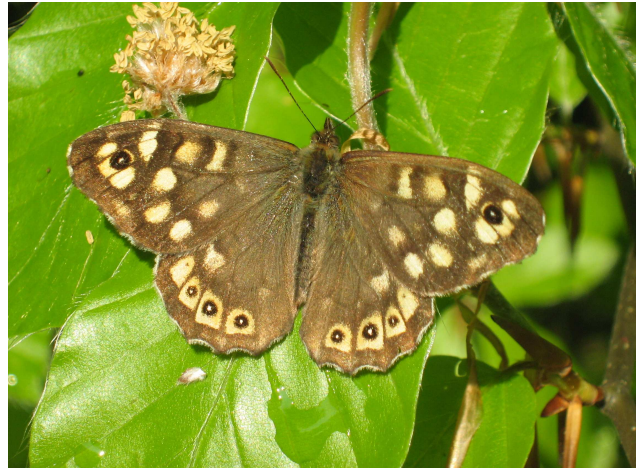
Waldbrettspiel- Mittlerweile sehr häufig in Parks und an Waldrändern