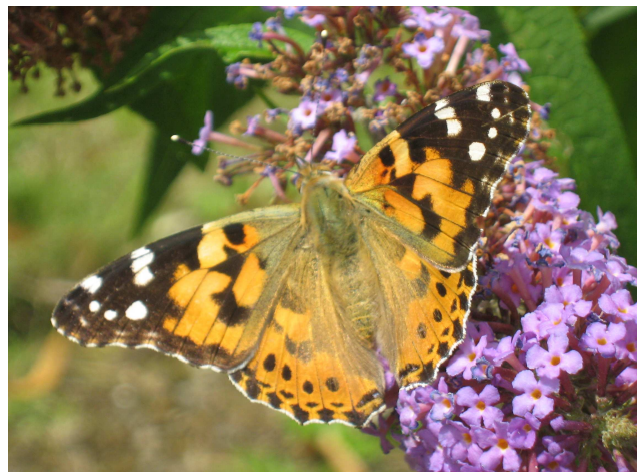
Distelfalter- Er wandert jedes Jahr aus Südeuropa ein.