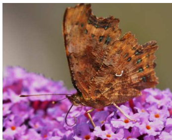
C-Falter- Das C-förmige Zeichen auf der Unterseite des Flügels gab ihm seinen Namen.