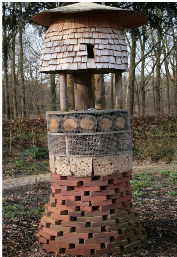
Hotel**** für Insekten

Insektenhotels werden fast ausschließlich aus Naturmaterialien gebaut. Der Fantasie sind dabei keine Grenzen gesetzt. Schilfrohrbündel, markhaltige Pflanzenstängel, Baumscheiben aus Hartholz wie z.B. Buche, mit Löchern von 2 bis 10 mm im Durchmesser, Backsteine, Tontöpfe mit Stroh oder Holzwolle gefüllt, Abschnitte von Bambusröhren und Lehmziegel, können die Zimmer dieses Hotels bilden. Die Grundkonstruktion besteht oft aus langen Kanthölzern und aus Quer- und Diagonallatten, die den Mittelbereich in Gefache unterteilen. Ein Schrägdach bildet den Abschluss. Die Gefache sollten, um sie vor Vögeln und andere ungebetene Gäste zu schützen, mit Kaninchendraht ummantelt werden. Auch Obstkisten aus Holz eignen sich für kleinere Bauten. Möglich sind auch einzelne „Motels“, indem man einen Tontopf mit Stroh füllt und separat aufhängt.